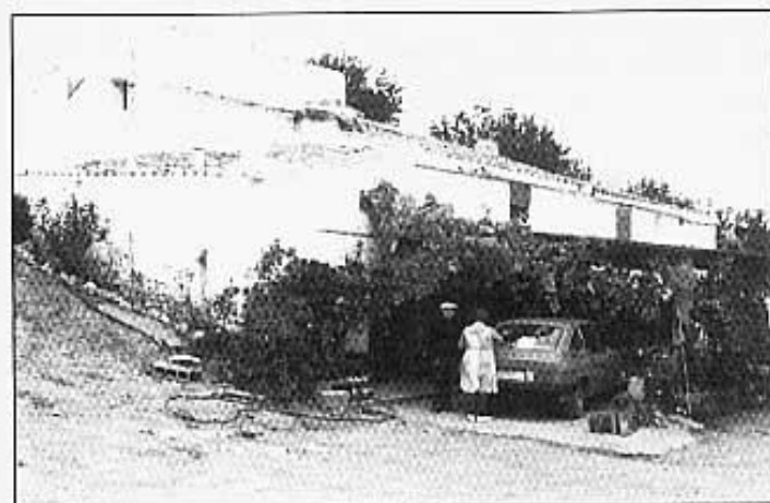
VISTA GENERAL DEL MAS.

"Tenim llum -diu Rogelio- però és escassa, no és forta, té poca potència perquè el transformador està massa lluny. Això ens crea una sèrie de problemes com que la bombeta de la sènia no tingue prou força, la peladora no va, etc. La tele i el frigorífic els aguanta bé. Respecte a l'aigua l'engaxem de la canonada que va a Tirig i l'aprofitem per a la casa, les granges, l'hortet, etc...".