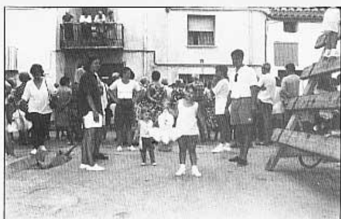
...I LA JOIA.