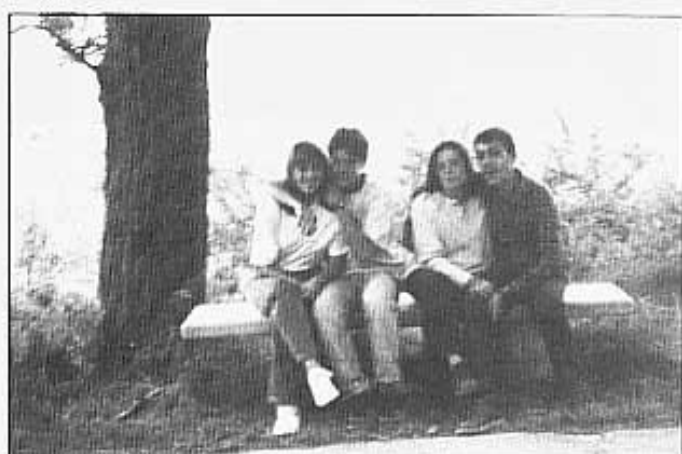
MÉS FESTA I MÉS AMISTAT.