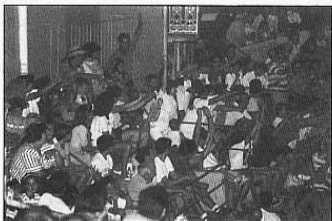
LA FAMOSA "OLA".