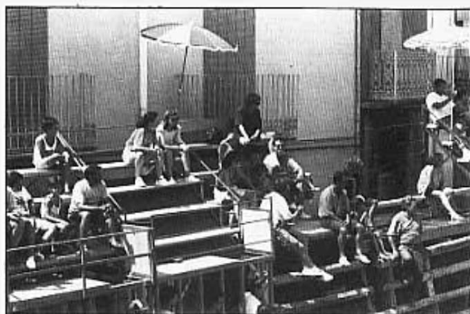
EL SOL APRETAVA DEL VALENT.