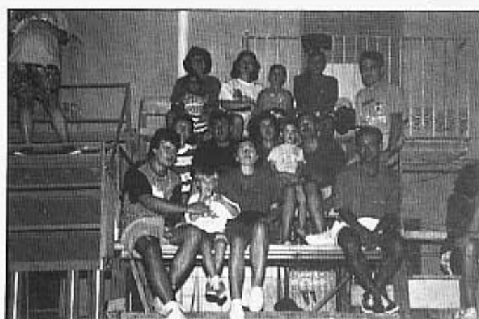
TOREROS DE BARRERA.