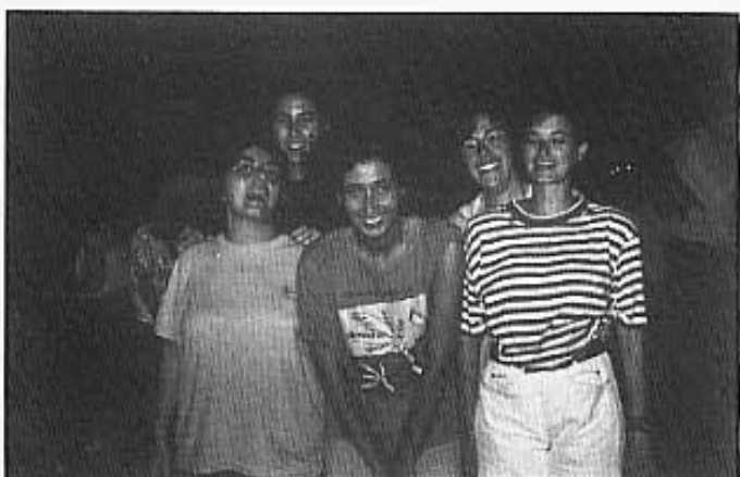
AMISTAT A TOPE.