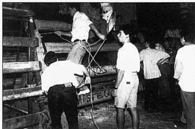
Desfent el cadafal dels Quintos.