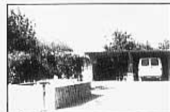
BASSA I GARATGE.