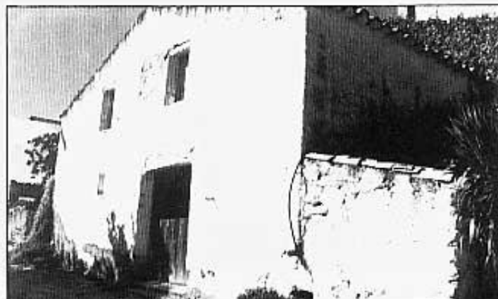
CASA MES VELLA DEL MAS.