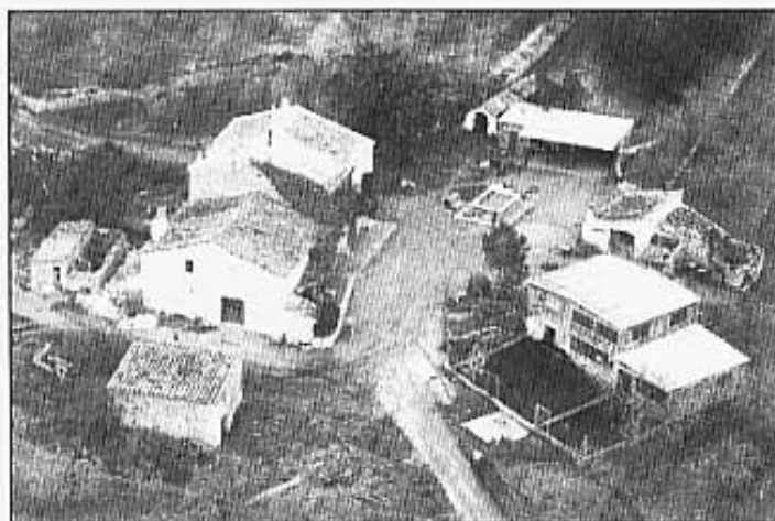
EL MAS D'EN GROC. VISTA AÈRIA.