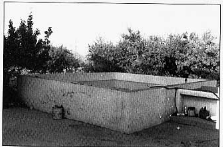
"La bassa em relaxa més que la dutxa...!".