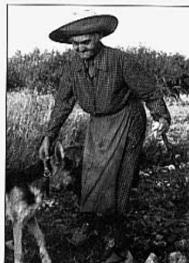
"No cal que em tireu cap retrato a mi!".