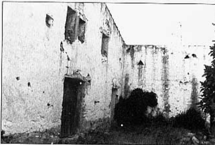
Abans hi vivia més gent...