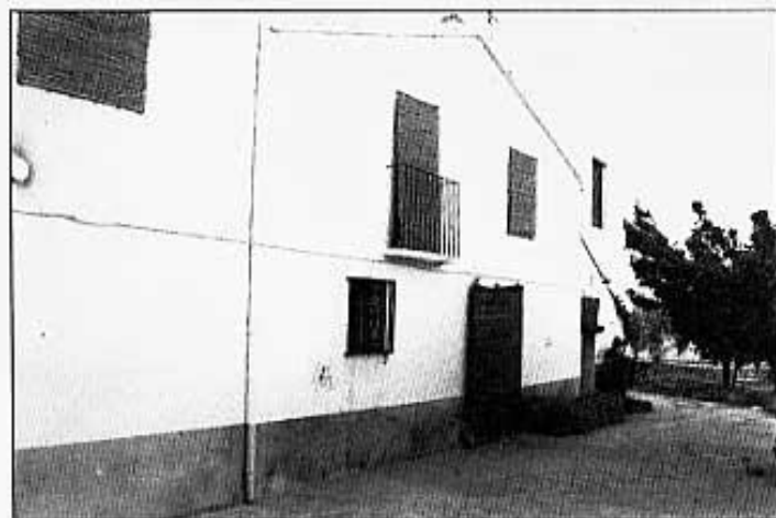
Única casa habitada.

El camí està en condicions pèssimes. Fa molts anys que es parla de quitar-