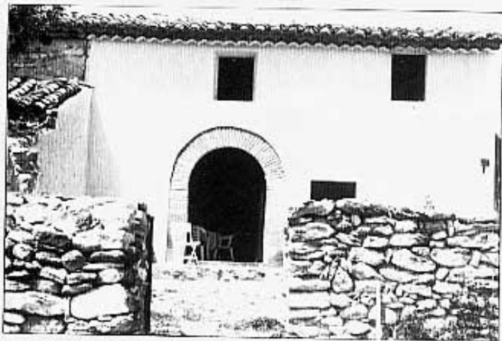
La placa solar a la teulada.