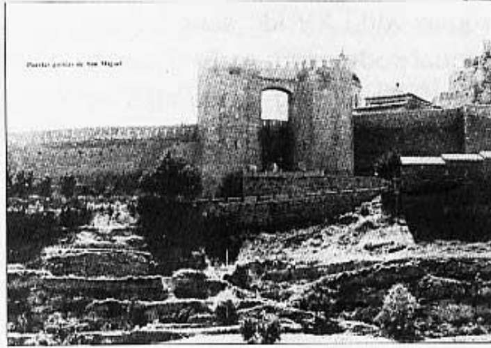
Porta de Sant Miquel

Morella no és la Basílica de Santa Maria, ni les seues murales, ni el castell, ni el claustre del convent de Sant Francesc.... Morella és tot el seu conjunt, és passejar pels seus carrers, és extasiar-se en un conjunt arquitectònic que ha sobreviscut al pas del temps per al nostre guadi i delectació.