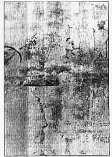
Sala Capitular. Convent S. Francesc

Dins del conjunt, haurem de parar especial atenció a la Basílica de Santa Maria (construcció gò-