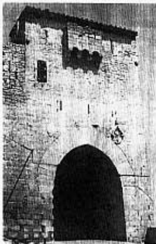
Porta de Sant Mateu

tica de principis del segle XIV) en la qual destquen les portes dels apòstols, el cor, amb la seua volta quasi plana (de forma que sembla quasi impossible que no es desplome), a l'igual de l'escala d'accés, que no té cap altre punt de suport més que la columna a la qual s'agafa en espiral. En la pedra de l'es-