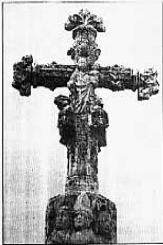
Creu de Les 3 Testes Coronades

Morella no és la Basílica de Santa Maria, ni les seues murales, ni el castell, ni el claustre del convent de Sant Francesc.... Morella és tot el seu conjunt, és passejar pels seus carrers, és extasiar-se en un conjunt arquitectònic que ha sobreviscut al pas del temps per al nostre guadi i delectació.