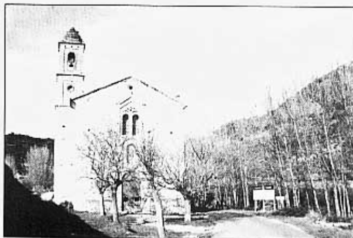
Ermita de la Verge de Gràcia