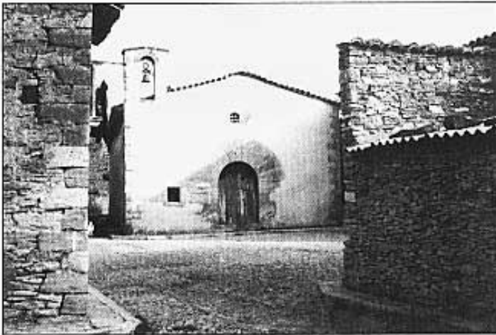
Ermita romànica. Sigle XIII

A Castellfort podrem accedir, abans d'anar a Vilafranca, des del Pla de la Canà (és el que nosaltres recomanem) o bé des de Vilafranca directament, des de Cinctorres o des d'Iglesuela passant per Portell. Si accepten la nostra recomanació, i després de deixar el Pla de la Canà, es trobaran sense voler -la carretera passa pel centre- amb l'ermitatge de la Mare de Déu de la Font, conjunt arquitectònic del segle XV, amb la seua font que invita a refrescar la gola i amb la seua albergueria -oberta a l'estiu-, a la sala superior de la qual hi ha pintures de finals del segle XVI de traços semblants als de Sant Pau, realitzats per un tal Cei.