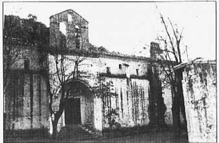
Ermita de la Mare de Déu de la Font

la qual destaquem la seua espadanya i campanar -fruit, potser, d'una promesa de D. Blasco de Alagón- i, al seu interior, els capitells, toscament treballats, amb diversos motius. A Sant Pere acudeix puntual tots els anys, el primer dissabte de maig, el romiatge que ix des de Catí i que és un dels més antics de la província, puix que existeixen notícies documentades d'ella de 1424.