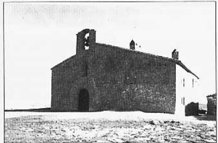
Sant Pere de Castellfort