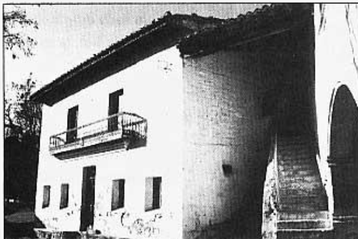
Albergueria de la Mare de Déu de la Font