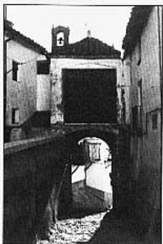
Portal de Sant Roc