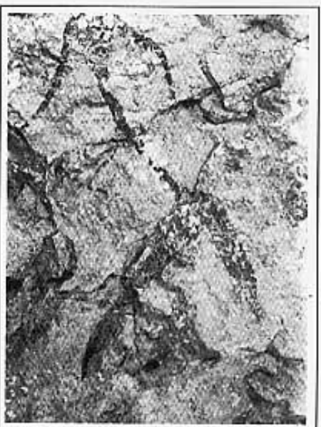
ARQUER DE TIPUS ESTILITZAT COVES DEL CIVIL