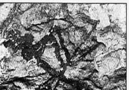
PERSONATGE ESTILITZAT EN POSSIBLE POSSICIÓ DE DANSA