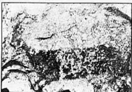
CÀPRIDO O CERVID DE COS ESTILITZAT. COVES DE LA SALTADORA.