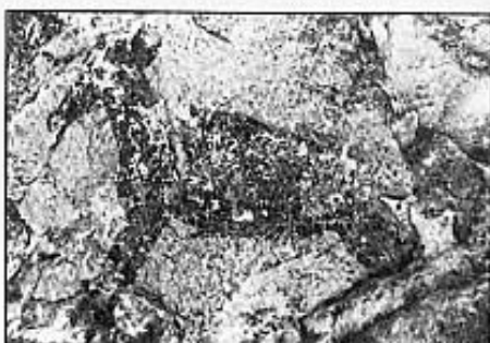
CÀPRIDO D'ESTIL NATURISTA