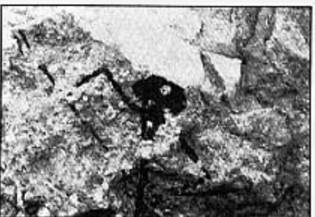
ESVELTA FIGURA DE ARQUER. COVES DE LA SALTADORA