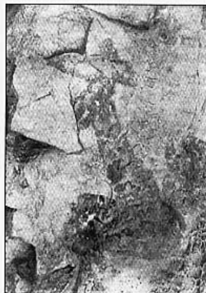
"VENUS DE LA VALLTORTA"