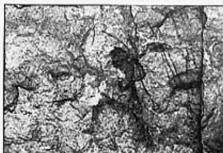
PERSONATJE D'UNA ESCENA DE CAÇA