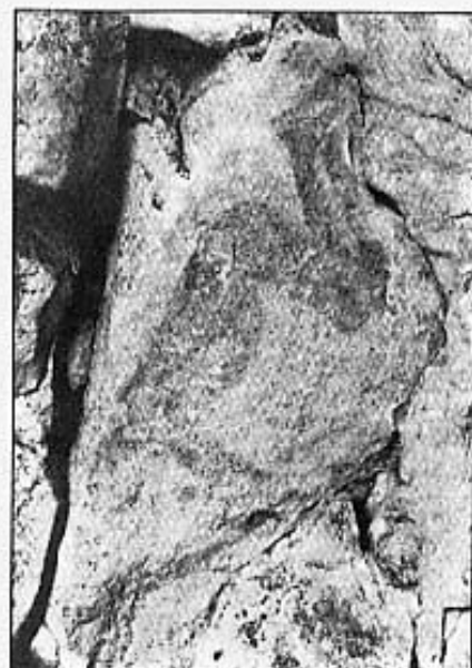
SUPOSAT CADÀVER COVES DEL PUNTAL