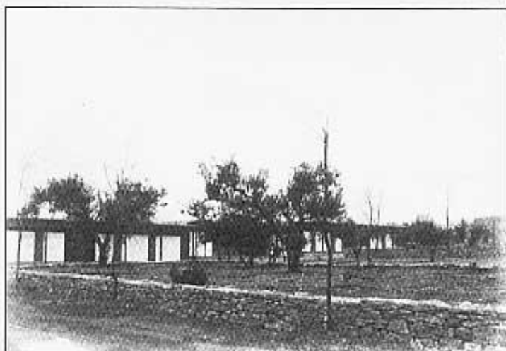
CÀMPING DEL "PARC CULTURAL DE LA VALLTORTA"