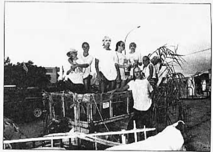
CARROSSA DE QUINTES DEL 92.