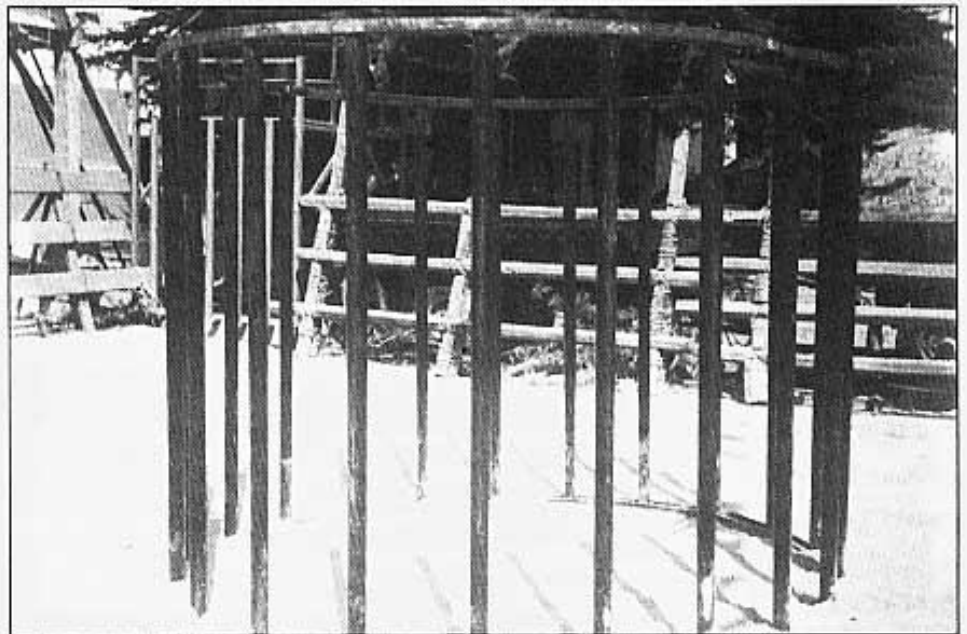
EL TOREIG DE GABIA HA CONTINUAT AMB ÈXIT.

La económia dels bous (exhibicions i assegurances) es