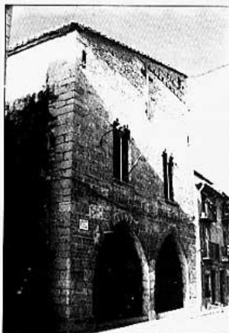
CASA MUNICIPAL (antigua llotja)

La casa municipal (antiga llotja) es un bell edifici del segle XV, amb un gran pati al qual donen entrada