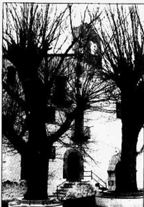
BALNEARI DE L'AVELLÀ

arcs ogivals amb reixes. A la part superior, destaquen dos elegants finestrals geminats.