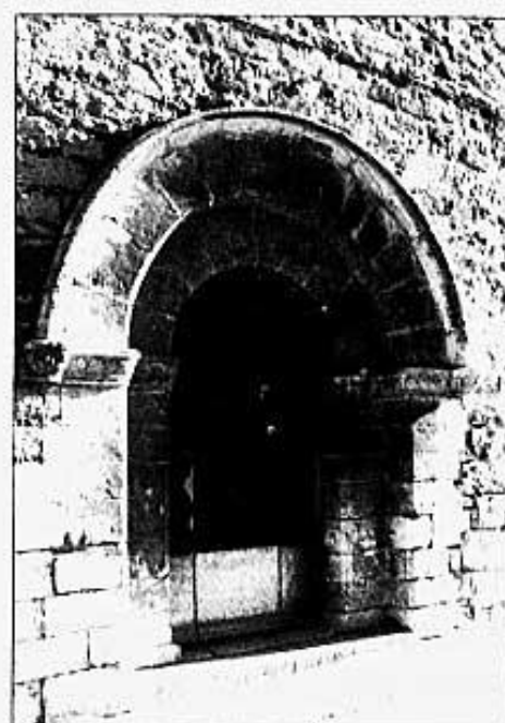
PORTA POSTERIOR ESGLESIA S. XIII