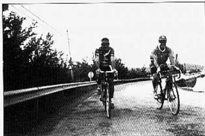
ELS PRIMERS KILÒMETRES