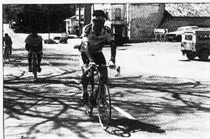
CAP A LA PISCINA