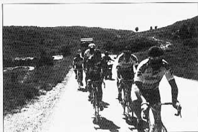
Tornant a casa - el camió - granera al darrere