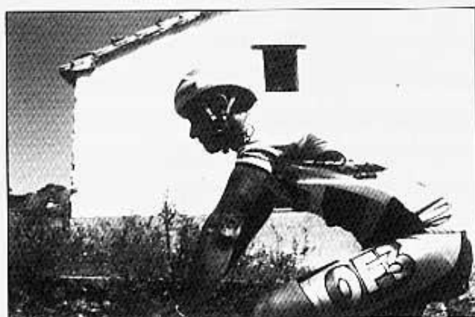
LA SEURETAT ÉS EL PRIMER