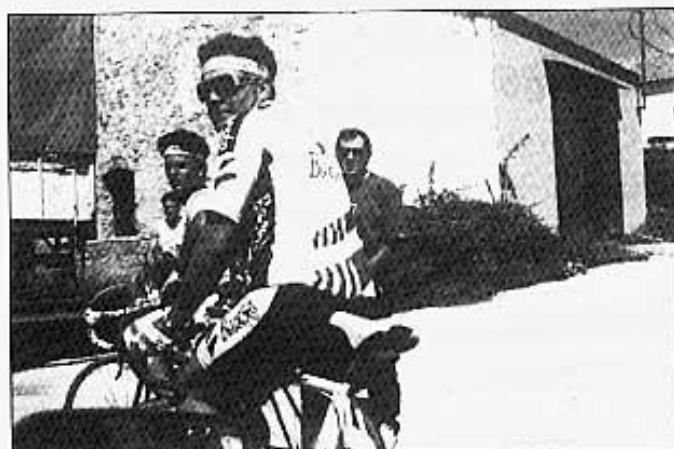
A LES PORTES DE MORELLA