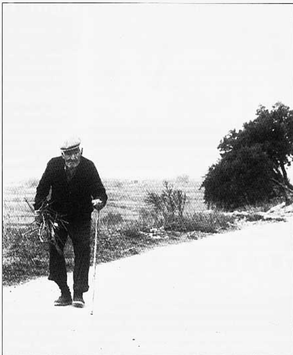
UN CAMINO SIN SALIDA PARA LOS "MASOVERS"

- "Aquí está mi Casa, mi Tierra y mi Vida". DEDICADO AL ÚLTIMO MASOVER: DONDE QUEDA UN SOLO HABITANTE O UNA SOLA FAMILIA.