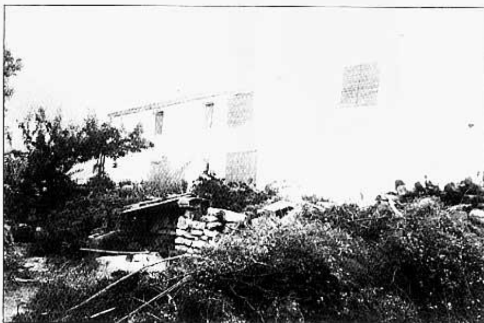
MAS DE SABOIA

Jo vaig néixer a eixa casa d'ahí davant que està tota assolada. Als 9 anys ens vam anar a Xàtiva quan la guerra. Al tornar