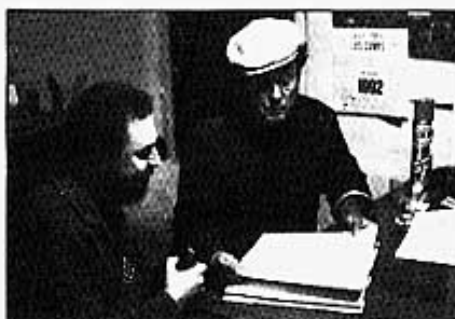
Com pots vore al llibre...