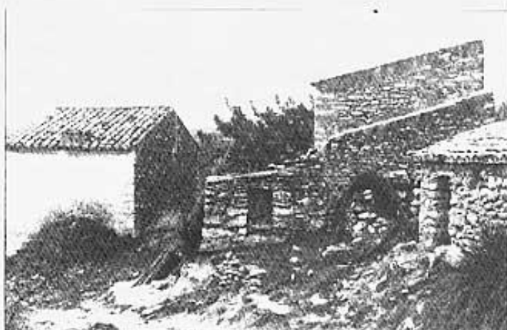
Un indret típic