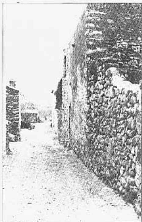
El testimoni de les pedres