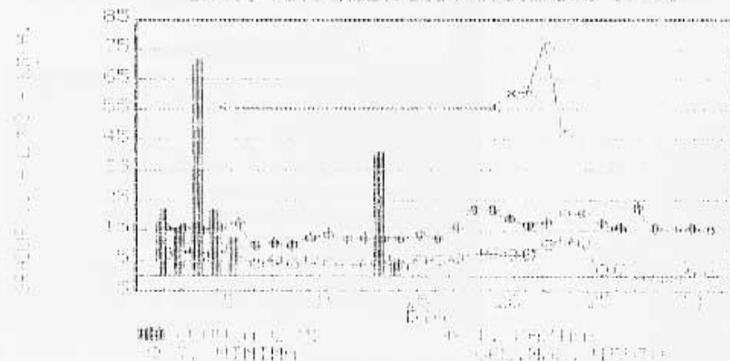
DADES METEOROLÒGICIS DICEMBRE 1.991

Continuaron las lluvias iniciadas los últimos días de noviembre, durante los cinco primeros días del mes, totalizándose 144 l/m 2 , pero donde verdaderamente llovió fue en Cataluña, donde se registraron lluvias acumuladas en algunos puntos de hasta 500 l/m 2 . El embolsamiento de aire frío se fue trasladando poco a poco hacia el norte de Africa y las lluvias cesaron el día 5. A partir de este día el tiempo entró en una monotonía en cuanto a lo que se refiere a la meteorología, solo alterada por la lluvia durante los días 13, 14 y 15 debido a una entrada de levante y a una tímida entrada de aire frío con vientos algo fuertes del norte que tubo lugar del día 19 al 23. Poco más que reseñar en este mes, salvo que en los últimos días del año las temperaturas mínimas descendieron por debajo de los 0° con algunas nieblas incluidas, dando una sensación de frío, pero solo en las madrugadas. Poco más cabe comentar de este mes, solo resaltar que en este mismo mes de diciembre del año pasado tuvimos una temperatura media de 8'4°, que contrasta bastante con los 10'6° de media que hemos tenido en este mes de diciembre; 2'6° de diferencia marcan una distancia que lo dice todo, aunque también hay que decir que el mes de diciembre de 1.990 fue el más frío que se recordaba en bastantes años atrás. Así pues habrá que esperar un año más para ver se tenemos unas navidades blancas, cosa harto difícil, por otro lado, en nuestras latitudes.