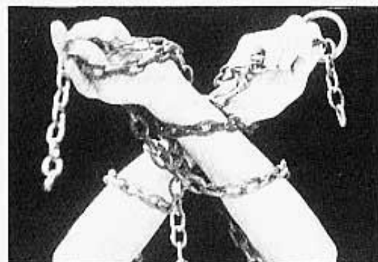
Pero no te rindas, aún así, no te rindas nunca... ¡¡Rómpelas!! Sé que puedes.