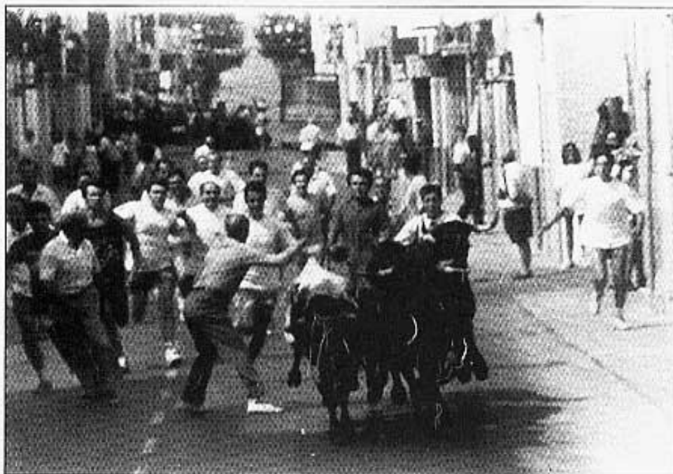
Amb risc del personal, l'entrada per la Raval.