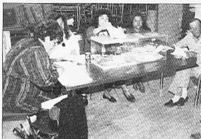
COMPONENTES MESA "A"